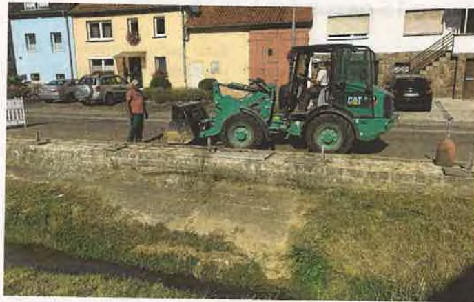
Der Abbau des vorhandenen Bachgeländers an der Alten Bahnhofstraße ist Voraussetzung für den bevorstehenden Aushub des Gewässers und die anschließende Sicherung und Erhöhung der Ufermauern

Zunächst wird eine Behelfsüberfahrt über den Gauangelbach hergestellt, um den Aushub aus dem Bach und das Baumaterial von der, bzw. auf die Mühlstra-