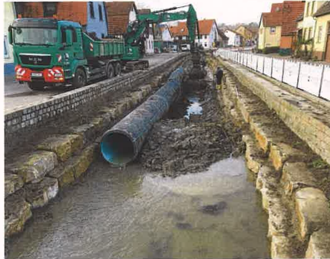
In den nächsten beiden Wochen vor der Winterpause wird der Bachlauf zwischen der Unteren Brücke und dem ersten Holzsteg in seiner künftigen Form fertiggestellt.