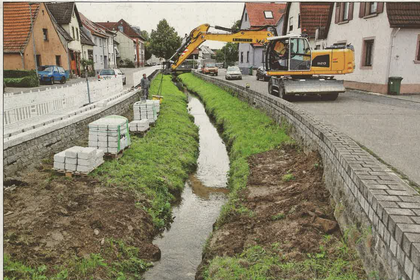
Zuerst wurden die Fische im Gauangelbach elektrisch abgefischt und bachabwärts ausgesetzt, eine Schwelle verhindert die Wiedereinwanderung. Nun wird das Gelände auf der Ostseite abgebaut, eine Behelfsüberfahrt eingerichtet und die erforderliche Bachtiefe ausgebagert.

Als erste größere Maßnahme wird dann das Ufer auf beiden Bachseiten bis auf die erforderliche Tiefe ausgebagert. Mit den Aushubarbeiten wird an der Unteren Brücke begonnen, die ausführende Firma arbeitet sich dann bachaufwärts Stück für Stück vor: Der Aushub wird zunächst zum Parkplatz an der Etten-Leur-Halle transportiert, dort beprobt und zwischengelagert. Vorgesehen ist ein Wiedereinbau des Materials für den Hochwasserschutz an anderer Stelle, wenn es die Bodenbelastung zulässt. Bis zum Jahresende 2021 soll die Baumaßnahme insgesamt abgeschlossen sein. Damit soll zunächst einmal ein ausreichender Hochwasserschutz in der Ortsmitte hergestellt werden, um verheerende Hochwasser mit immensen Schäden wie jenes vom Mai 2016 möglichst zu verhindern. Das Gewässer soll aber auch soweit wie möglich ökologisch aufgewertet und für die Öffentlichkeit zugänglich und erlebbar gemacht werden.