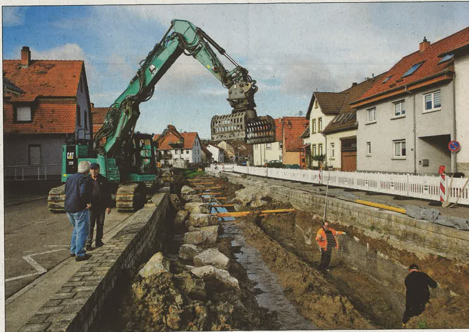
Erster Schritt für den hochwassersicheren Ausbau des Gauangelbachs: Die Fundamente der Ufermauern werden verstärkt. In manchen Bereichen werden die Mauern zudem erhöht. Anschließend werden Flussbausteine eingesetzt, um die Fundamente zu schützen.

Der neue Bachlauf wird dabei nicht wie zurzeit in gerader Linie geführt, sondern in unterschiedlicher Breite und einem geschlängelten Verlauf angelegt. Um die Abflussmenge von 15 Kubikmeter pro Sekunde für ein einhundertjähriges Hochwasser zuzüglich Klimafaktor abzuführen, muss der Abflussquerschnitt des Gauangelbachs deutlich vergrößert werden. Da die Gewässerbreite durch die beiden