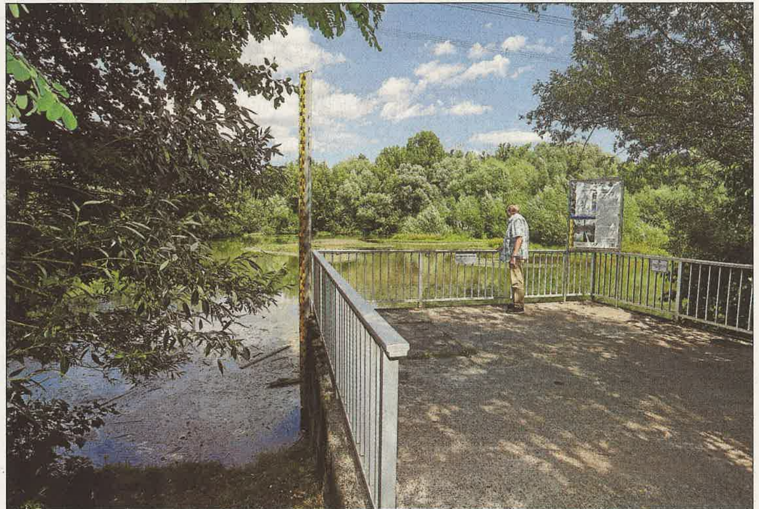
Weil die technischen Anlagen des Hochwasserrückhaltebeckens in Mühlhausen in die Jahre gekommen sind, soll es ab 2021 modernisiert werden. Insgesamt sollen 950 000 Euro investiert werden.