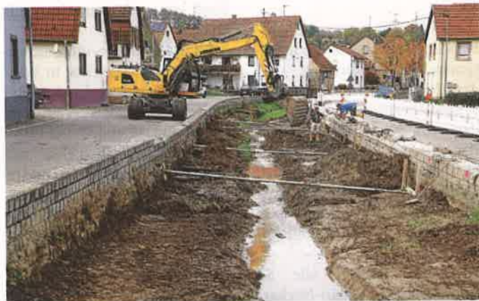
Die Sanierungsarbeiten am Gauangelbach in Baiertal gehen zügig voran.