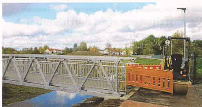
Noch steht kein Gebäude im Bereich „Quartier am Bach“ – die Brücke über den Gauangelbach in Richtung Stadtmitte ist jedoch bereits fertig.

Richtung Dielheim werden 16 Mietwohnungen gebaut, hinzu kommt ein Lebensmittelmarkt.