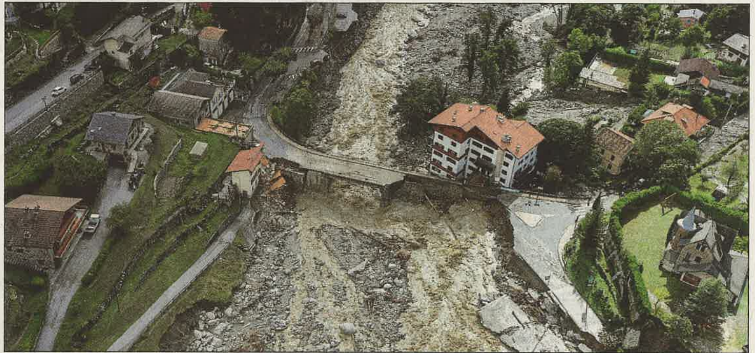
Diese Luftaufnahme zeigt die Schäden im französischen Saint-Martin-Vesubie, die von schweren Regenfällen verursacht wurden.

In Österreich mussten Rettungskräfte am Freitagabend und Samstag zu zahlreichen Einsätzen wegen umgestürzter Bäume und kleinerer Überflutungen ausrücken. Ein vierjähriges Mädchen wurde bei einer Wanderung von einem Baum erschlagen. In der Schweiz brachte das Tief am Samstag enorme Mengen Regen mit sich, die Autobahn A2 war stundenlang wegen Überflutung gesperrt. In einem Tal im Tessin wurde laut dem Sender SRF mit 421 Millimetern in 24 Stunden die zweithöchste Regenmenge jemals in der Schweiz gemessen.