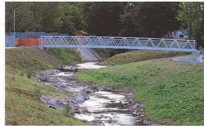
Der Ausbau hat sich gut der Natur angepasst.