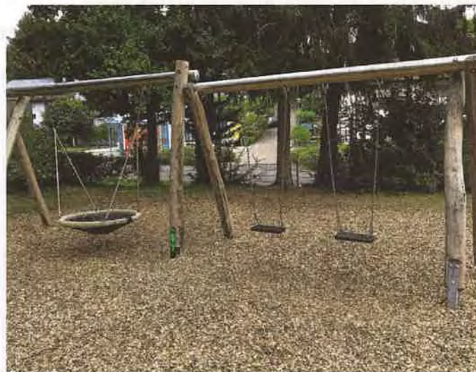
An einem der beiden Schaukelsitze wurden zwei Schrauben gelöst und entfernt.

Mittlerweile wurde der Schaden durch die Mitarbeiter des Bauhofes beseitigt und die Kinder dürfen die Schaukel wieder benutzen.