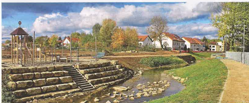
Der Ausbau des Gauangelbachs am Rande des Neubaugebiets „Quartier am Bach“ ist nahezu abgeschlossen

Zwei ehemals als Wohngebäude genutzte Anwesen waren zuvor abgerissen worden, da, so der Bauträger, die alte Substanz nicht mehr erhaltungswürdig gewesen sei. Die neue Wohnanlage wird ein Bindeglied zwischen der Randbebauung an der Ringstraße und der Quartiersbebauung zum Neubaugebiet in der Küferstraße aus den 1990er-Jahren angesehen. Das Grundstück mit einer Nord-Süd-Ausrichtung wird mit einer durchgängigen Tiefgarage