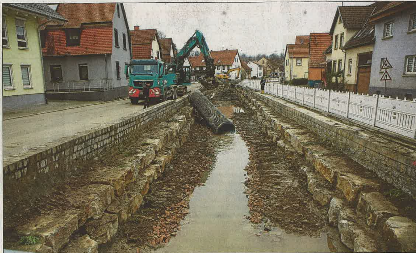
Ein erster Teilabschnitt zum hochwassersicheren Ausbau des Gauangelbachs in Baiertal ist abgeschlossen, ehe die Baufirma den Weihnachtsurlaub antritt.

Man gibt sich jedoch nicht nur damit zufrieden, ein ausgedehntes Profil des