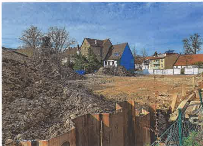
Bis spätestens Anfang 2022 sollen an der Ringstraße zwölf Eigentumswohnungen sowie Geschäftsräume und Arztpraxen entstehen.

Eigens für das Projekt, das sich wegen der Bodenbeschaffenheit verzögert hatte, wurde von „Dombrowski Massivbau“ eine eigene Gesellschaft gegründet – die „Ringstraße Wiesloch GmbH & Co. KG“. Mit der Bezeichnung „vis-à-vis“ will man auf die aus Sicht der Bauträger exponierte Wohnlage hinweisen, da alle wichtigen Einkaufsmöglichkeiten und die Nähe zur Innenstadt vorhanden seien. Eigentumswohnungen in der Größe von 68 bis 146 Quadratmetern entstehen. An der Ringstraße selbst werden die Büroräume und Arztpraxen angesiedelt sein, im hinteren Bereich die eigentlichen Wohnungen.